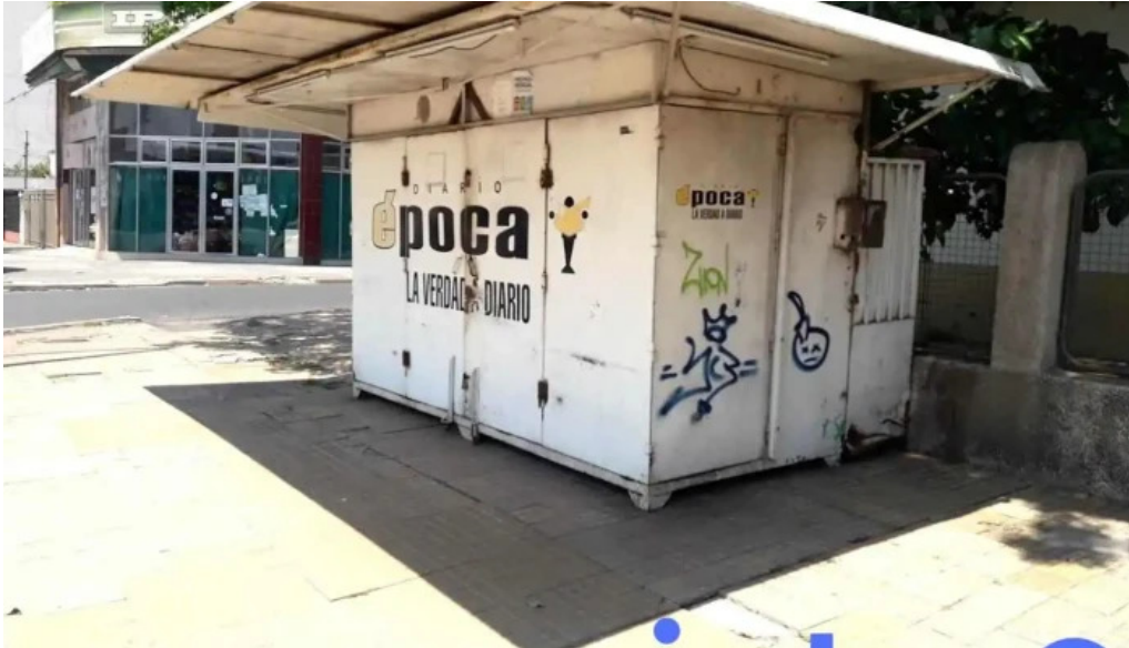
Puesto de diarios y revistas av 3 de abril corrientes